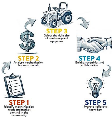
Gambar 2. Lima Steps Pengembangan Bisnis Model Mekanisasi Pertanian Efektif

Lima langkah penting dalam pengembangan bisnis model mekanisasi pertanian yang efektif, sebagaimana yang disarankan oleh FAO (2024) dalam Gambar 2. Langkah-langkah tersebut mencakup identifikasi kebutuhan pasar, desain dan adaptasi teknologi, pengembangan kapasitas petani, pembentukan jaringan distribusi dan perawatan, serta penciptaan skema pembiayaan yang mendukung keberlanjutan operasional alat. Pendekatan ini bertujuan untuk memastikan bahwa mekanisasi pertanian tidak hanya berfokus pada pengembangan teknologi, tetapi juga pada aspek ekonomi dan sosial yang mempengaruhi adopsi dan keberlanjutan teknologi di lapangan (FAO, 2024).